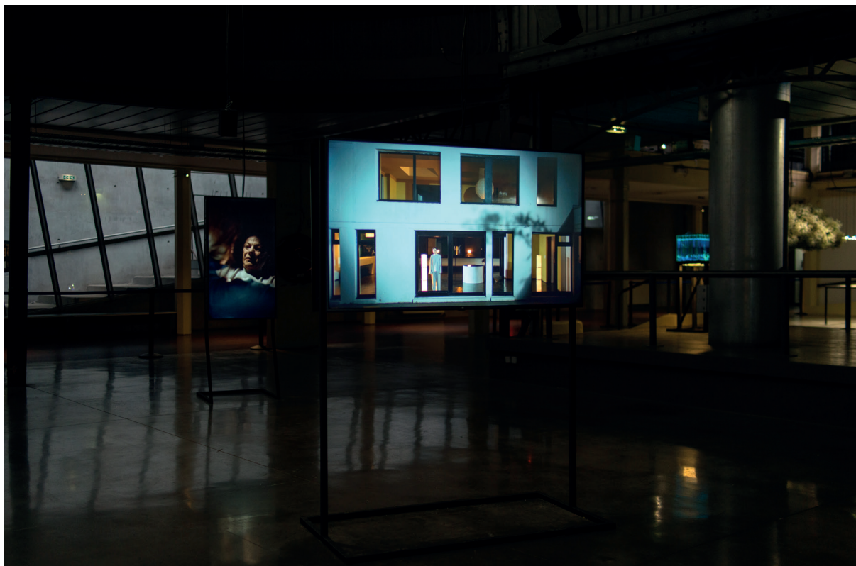
Ethel Lilienfeld, Invisible Filter , 2022. Vue de l'exposition Panorama 24 .

Basé à Tourcoing, Le Fresnoy — Studio national des arts contemporains est une école d'art de haut niveau spécialisée dans l'audiovisuel, qui propose un cursus en deux ans durant lesquels les étudiants doivent réaliser un projet artistique.